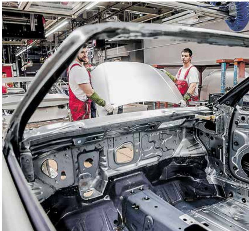
Az erősödéshez leginkább a beruházások járultak hozzá

– A bruttó hazai termék az év harmadik negyedévében 3,9 százalékkal haladta meg az előző év azonos időszaki értékét – közölte tegnapi részletes adatközlésében a Központi Statisztikai Hivatal (KSH). A növekedéshez elsősorban a piaci alapú szolgáltatások járultak hozzá. A szezonálisan és naptárhattással kiigazított és kiegyensúlyozott adatok szerint a gazdaság teljesítménye az előző év azonos negyedévéhez mérten 4,1, az előző negyedévhez viszonyítva 0,9 százalékkal nőtt. Az év elejétől a harmadik negyedév végéig bezárólag a GDP 3,8 százalékkal növekedett az egy évvel korábbihoz képest. Mindebből az is következik, hogy a korábban vártnál jobb teljesítményt nyújtott a harmadik negyedévben a magyar gazdaság. A KSH első becslésében még 3,6 százalékos növekedés szerepelt. Németh Dávid, a K&H Bank vezető elemzője szerint a korrekció megjelentését jelent. – Arra persze számítani lehetett, hogy a növekedés egyik motorját a piaci szolgáltatások jelentik. Az ágazaton belül a kereskedelem, valamint a vendéglátás és a szálláshely-szolgáltatás produkált komolyabb növekedést,